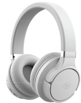
Manual do usuário Elite Bass Headphone Fone de ouvido supra-auricular