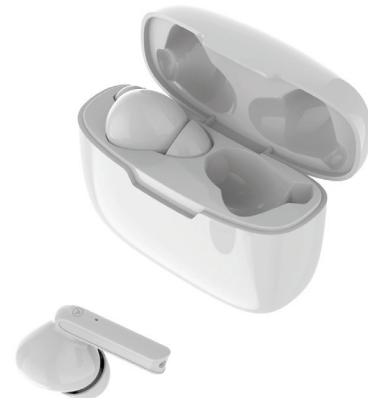
User manual Flow TWS Earbuds TWS earbuds